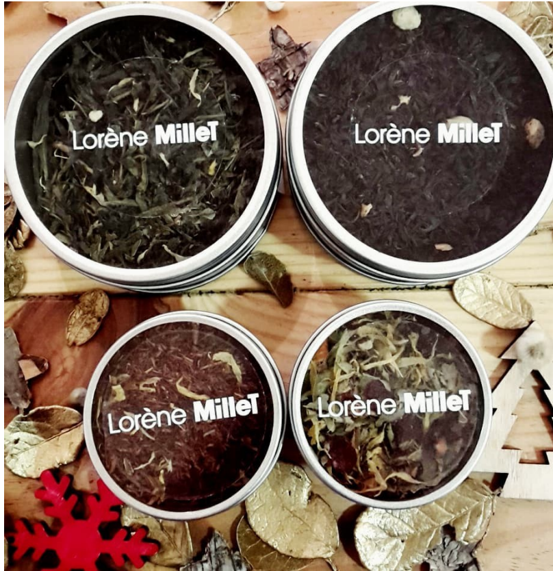
Coffrets Duo Noël et Mini Duo Noël Zen