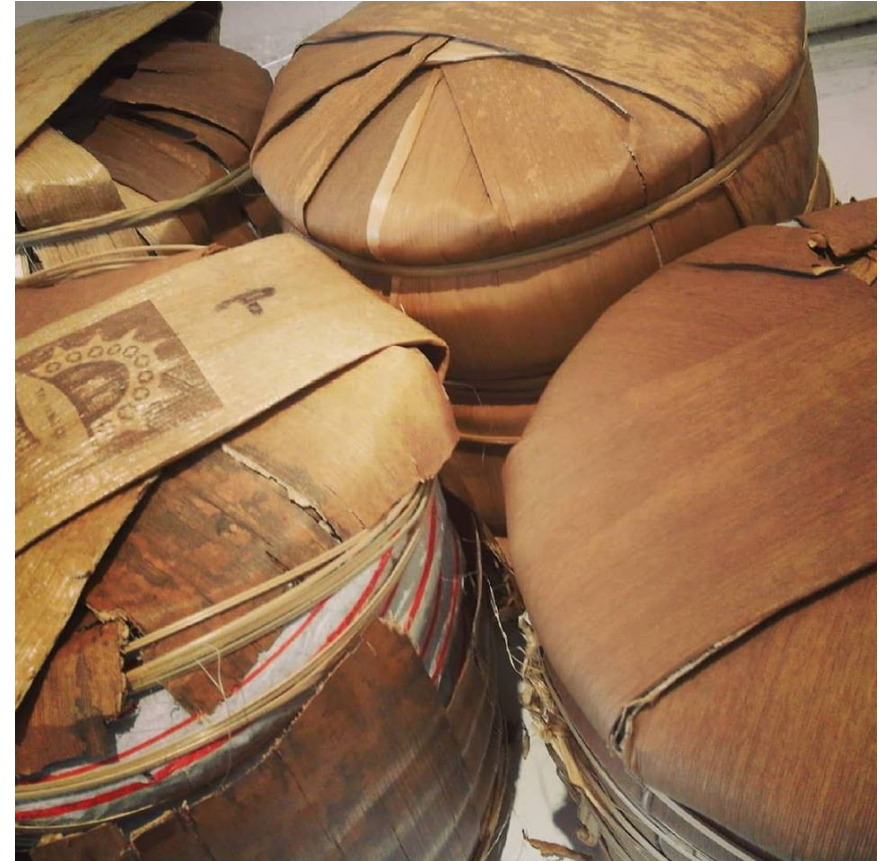
Galettes de puerh emballées dans des tongs artisanaux (emballage traditionnel des galettes).