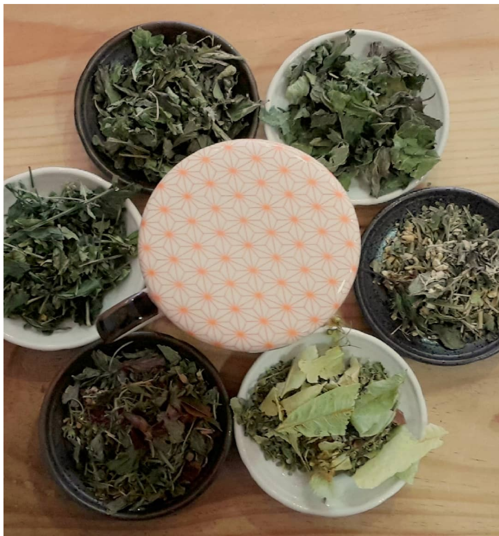
Infusions Bio d'Auvergne