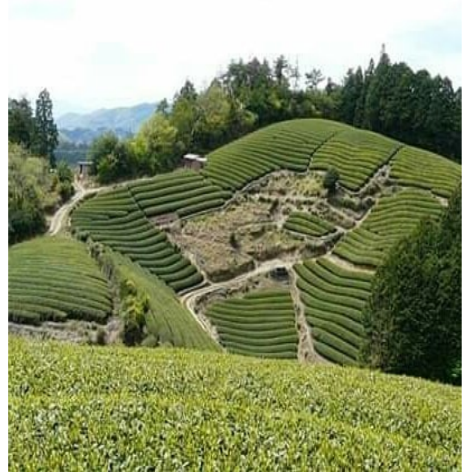
Jardin de thé - Japon