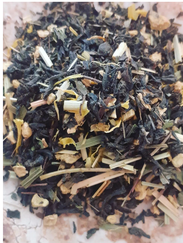
Rêve de Marrakech Bio