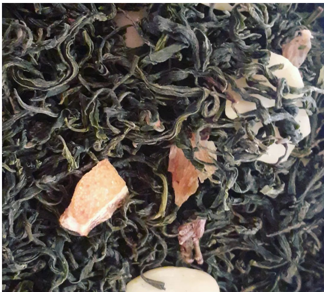
Trésor d'orient Bio