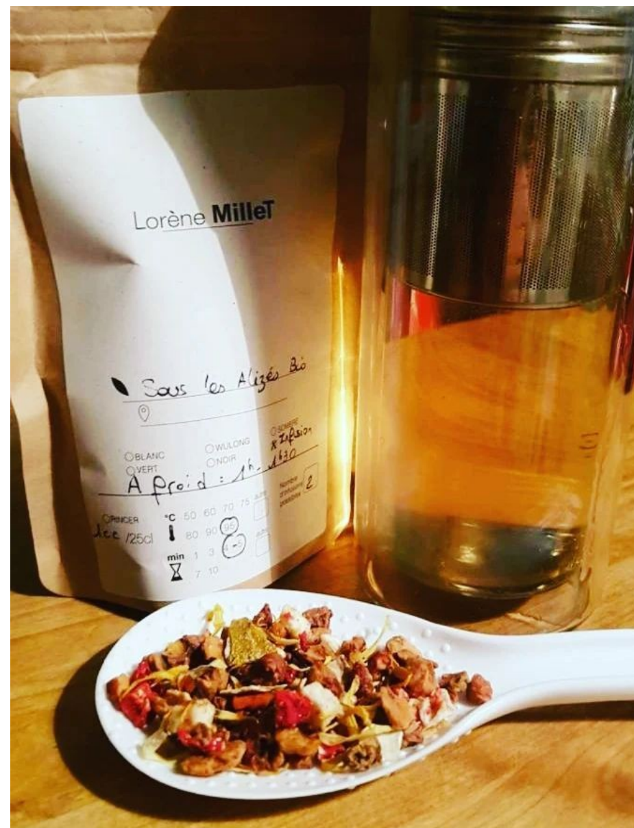
Sous les alizés Bio

Pomme, poire, kiwi, coing, caramel. Infusion douce et fruitée, aux notes comptées .