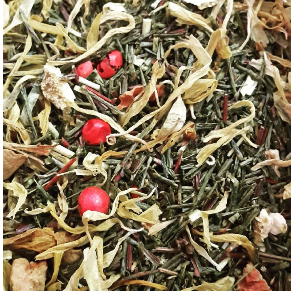
Sieste en Provence Bio