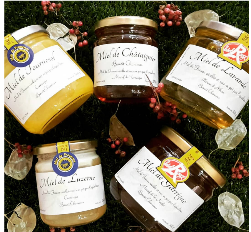
Miel l'Abeille de l'Estaque