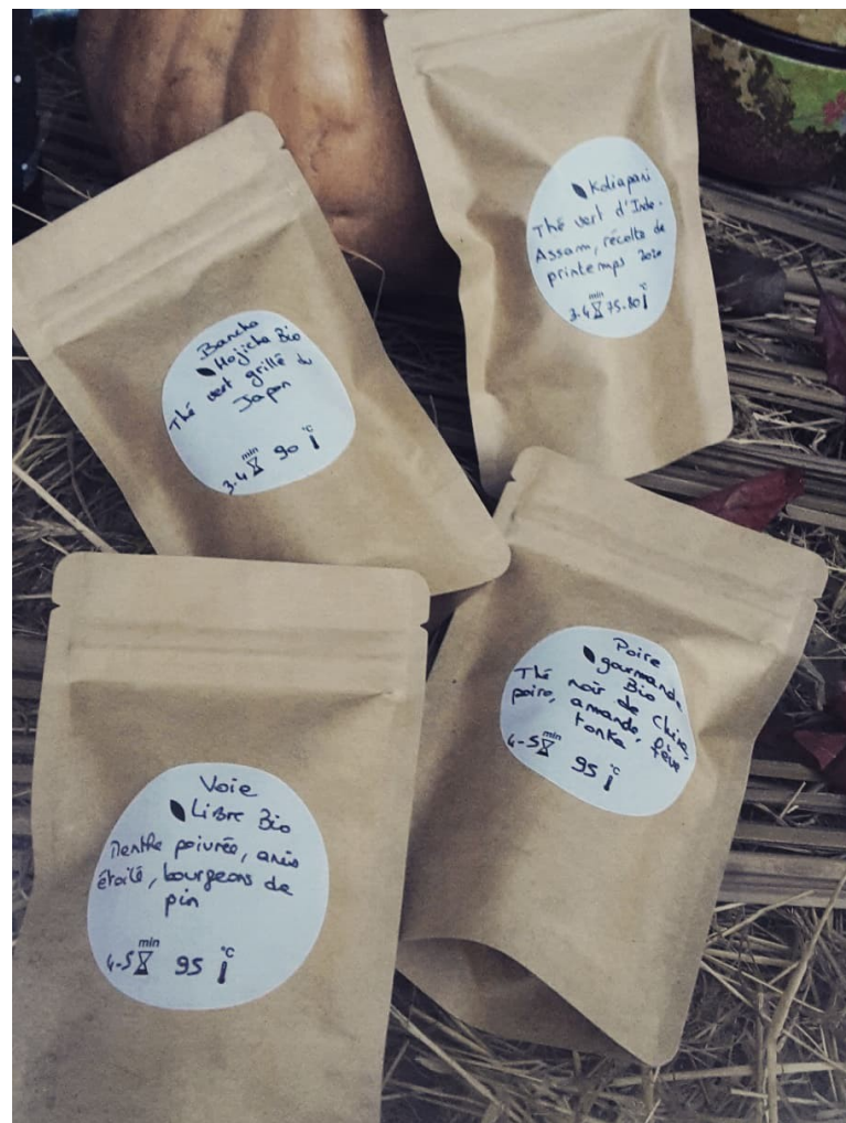
Sélection du mois