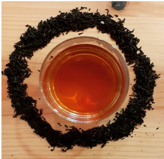
Douceur de Séville Bio