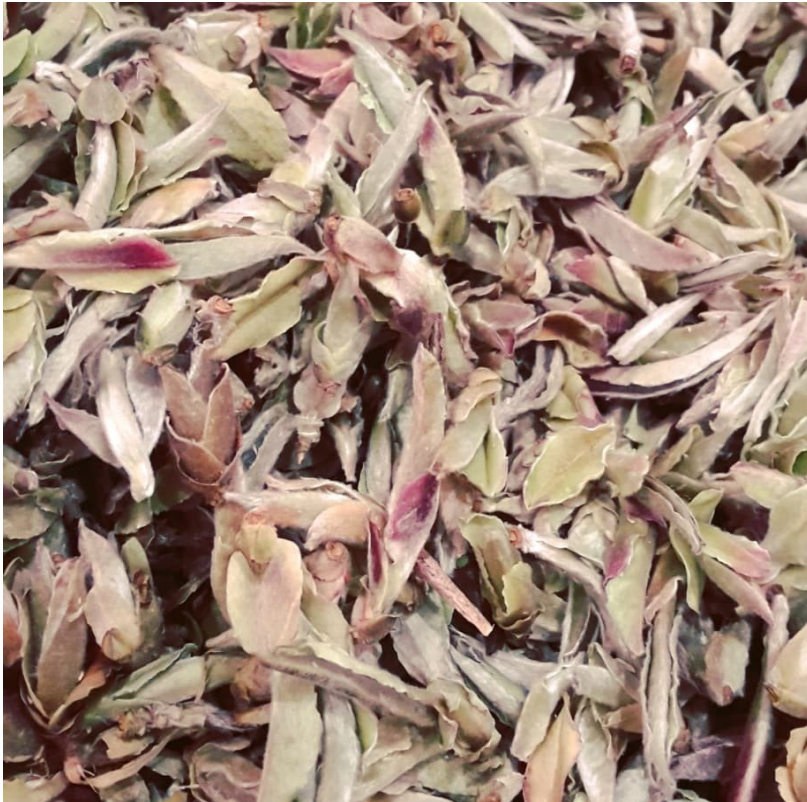
Bourgeons de Nan Mei