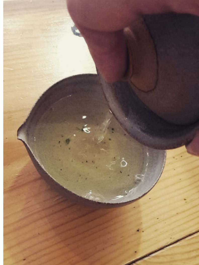
Infusion d'un Tie Guan Yin