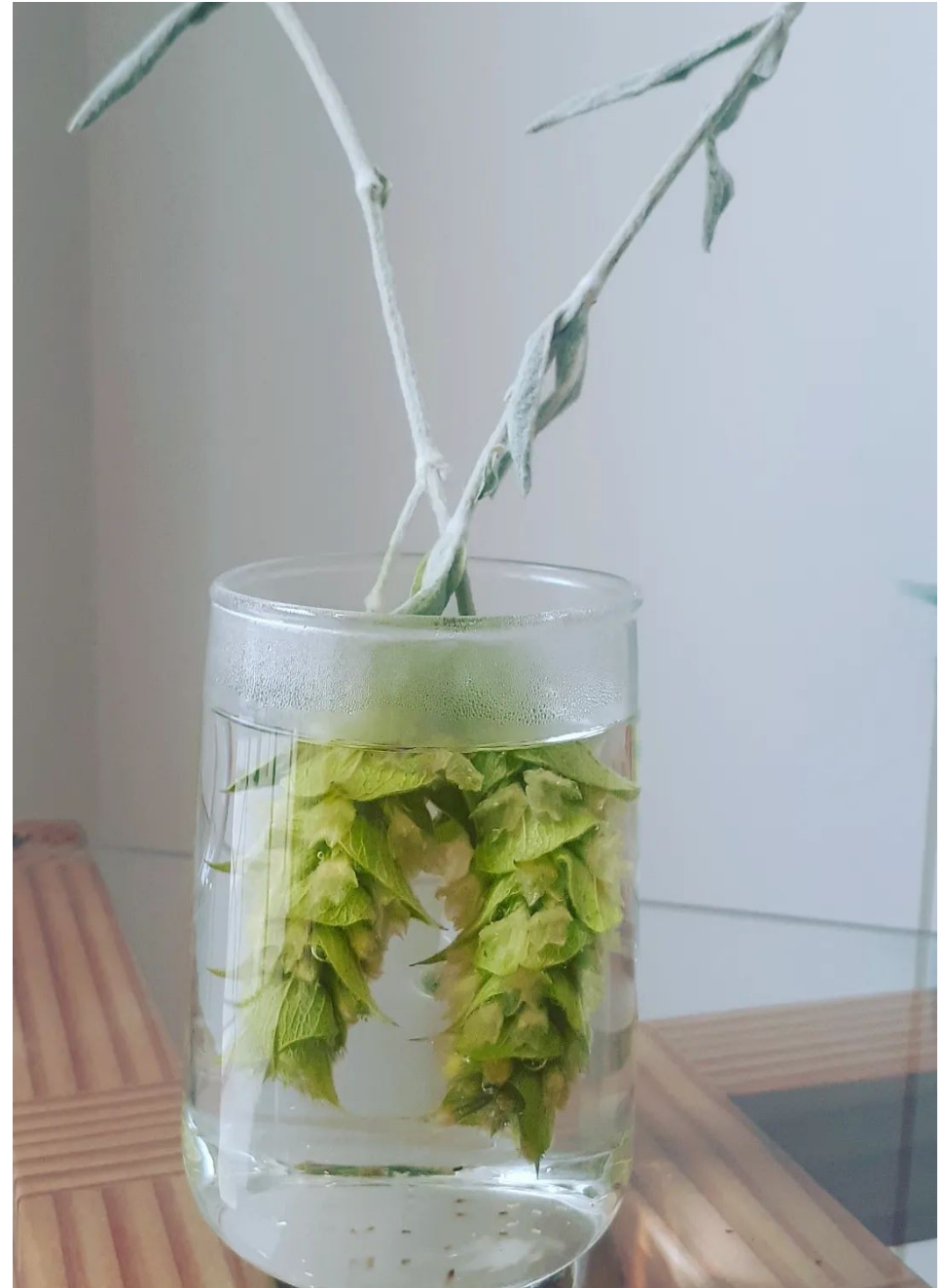
« Thé » des Monts grecs